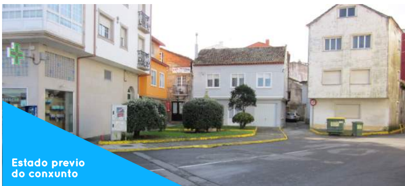
Estado previo do conxunto

Esta intervención serve para completar as obras das rúas Atalaia e a Roda. De feito, tanto as beirarrúas como as instalacións soterradas resolvéronse de xeito similar ás rúas anexas, co obxectivo de facer a mellor transición posible entre os distintos pavimentos existentes.