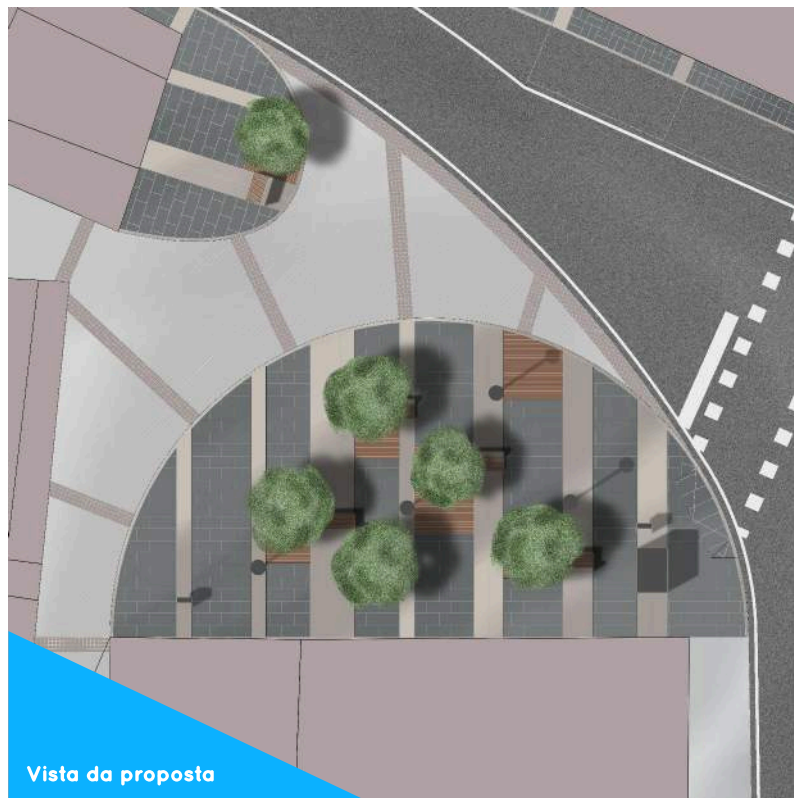
Vista da proposta