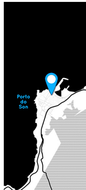
Porto do Son

Esta intervención serve para completar as obras das rúas Atalaia e a Roda. De feito, tanto as beirarrúas como as instalacións soterradas resolvéronse de xeito similar ás rúas anexas, co obxectivo de facer a mellor transición posible entre os distintos pavimentos existentes.