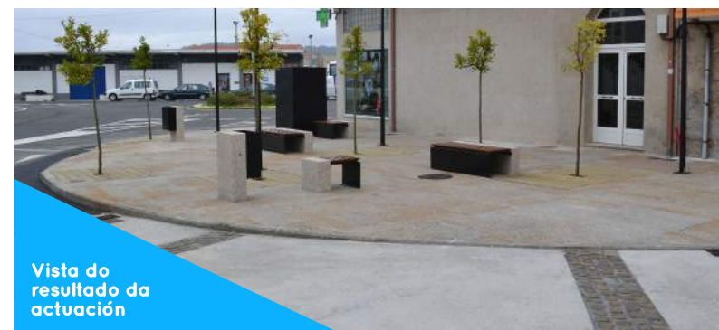
Vista do resultado da actuación