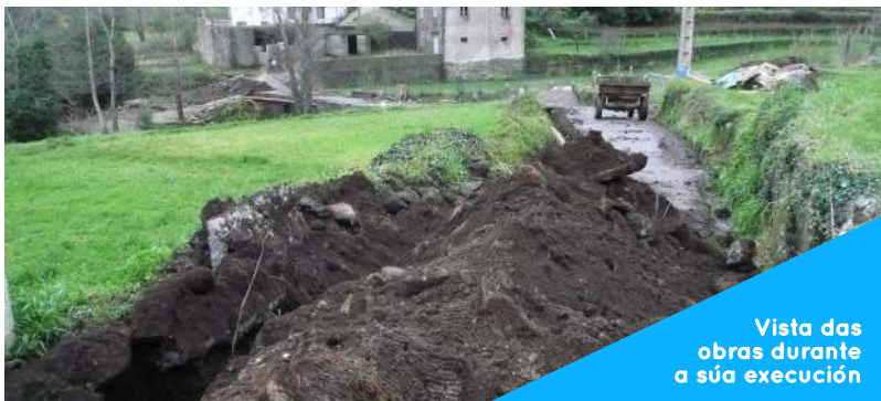
Vista das obras durante a súa execución