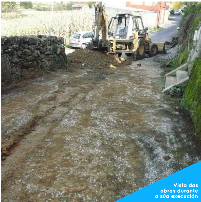
Vista das obras durante a súa execución