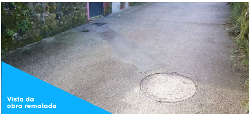
Vista da obra rematada