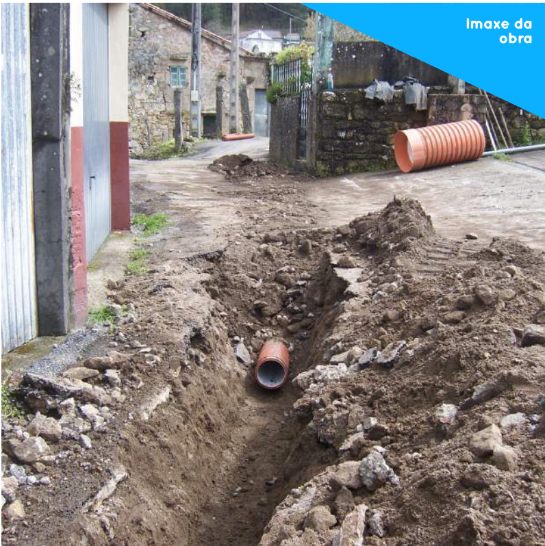
Imaxe da obra