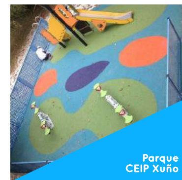
Parque CEIP Xuño