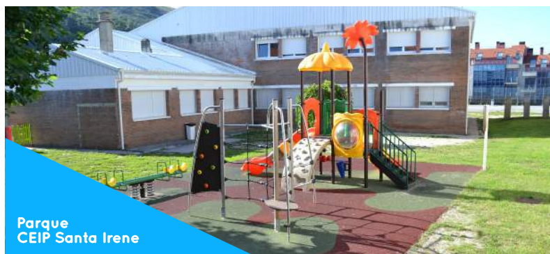
Parque CEIP Santa Irene