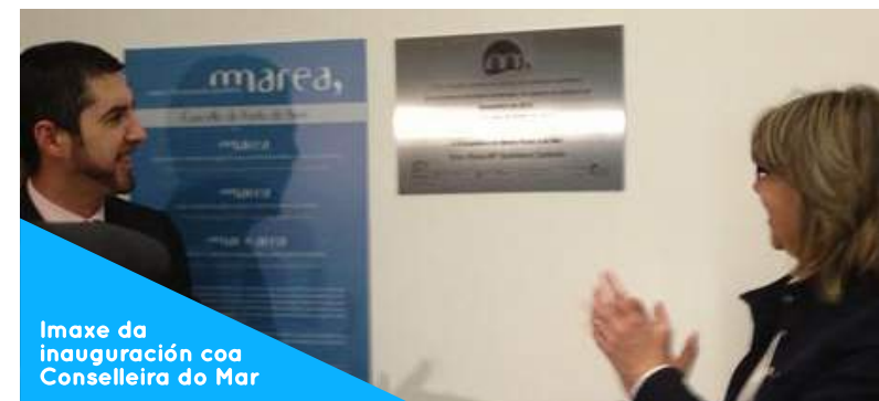
Imaxe da inauguración coa Conselleira do Mar