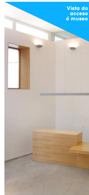
Vista do acceso ó museo

O actual museo Marea é o resultado de distintas fases de actuación que se estenderon entre os anos 2010 e 2012. Durante todo o proceso transformouse unha vivenda, que incorporaba un forno na súa parte traseira, nun museo adicado a explicar como convive a xente de Porto do Son co seu entorno.