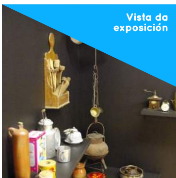
Vista da exposición