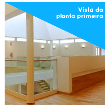
Vista da planta primeira

O edificio resultante combina partes da vivenda orixinal con outras de nova factura, destacando o uso de materiais como o aceiro e vidro nas súas fachadas. O interior articula unha serie de espazos de exposición o redor do forno preexistente.