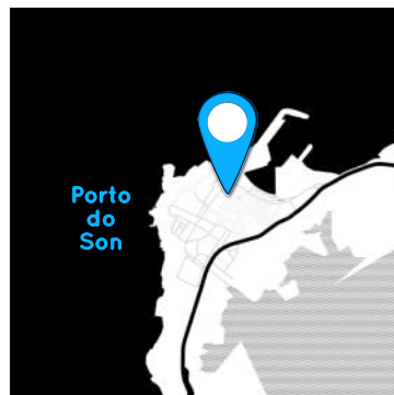
Porto do Son