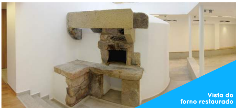
Vista do forno restaurado