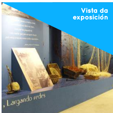
Vista da exposición