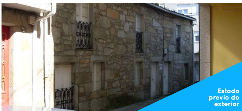
Estado previo do exterior

O actual museo Marea é o resultado de distintas fases de actuación que se estenderon entre os anos 2010 e 2012. Durante todo o proceso transformouse unha vivenda, que incorporaba un forno na súa parte traseira, nun museo adicado a explicar como convive a xente de Porto do Son co seu entorno.