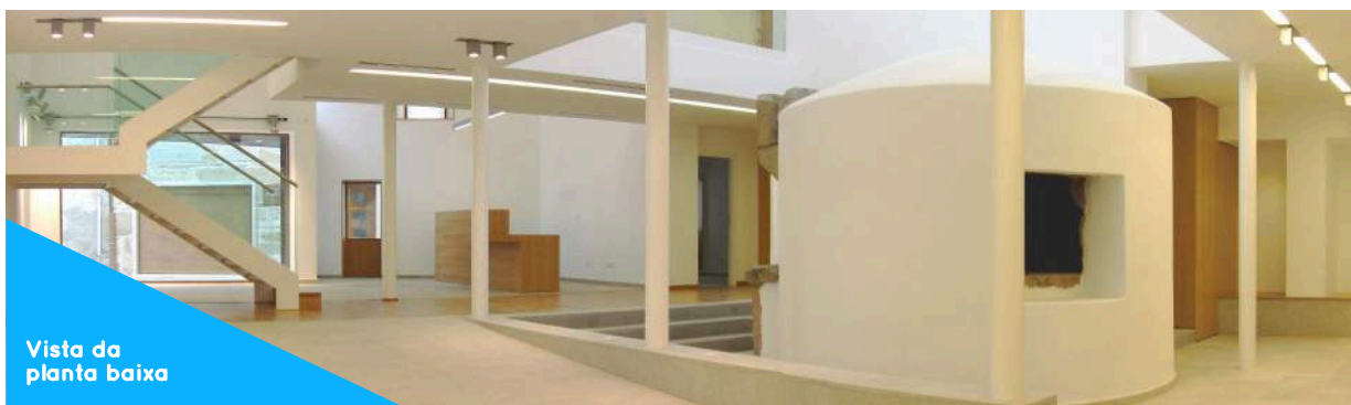
Vista da planta baixa