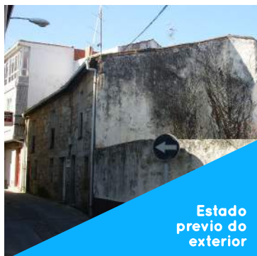
Estado previo do exterior