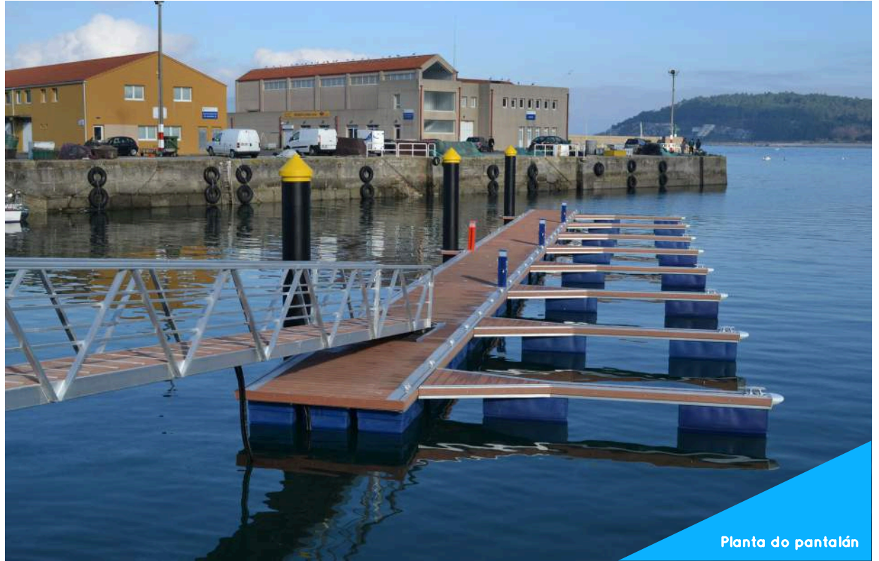
Planta do pantalán