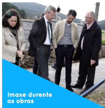
Imaxe durente as obras