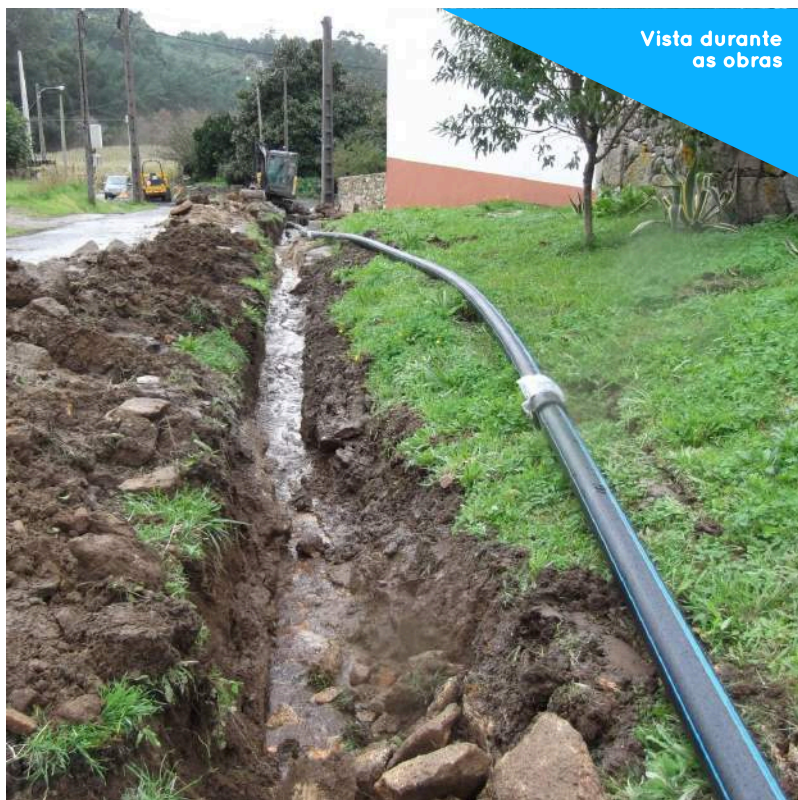
Vista durante as obras