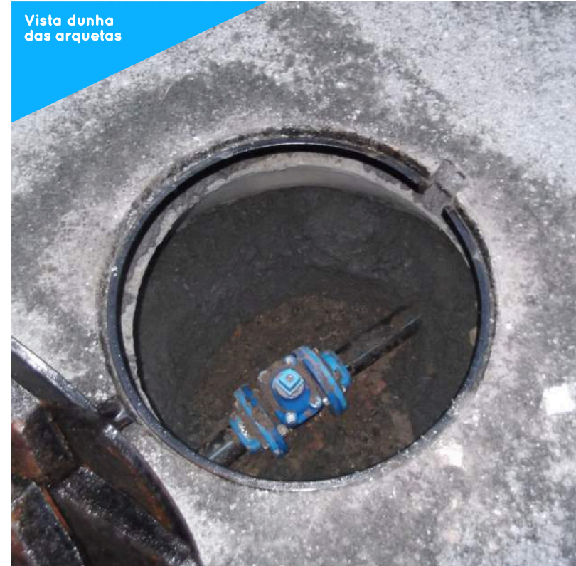
Vista dunha das arquetas