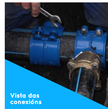
Vista das conexións

Orzamento 94.460,73€ Data de finalización Decembro 2014 Financiamento Consellería de Presidencia, Administracións Públicas e Xustiza